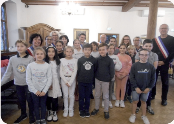
Le Conseil Municipal des Jeunes 2022-2023

Le CMJ, créé en 2002 et étant renouvelable par moitié tous les ans, des élections se sont déroulées dans les 2 écoles le 27 septembre, en présence d'adjoints ceints de leurs écharpes, et de membres de l'équipe d'animation du CMJ.