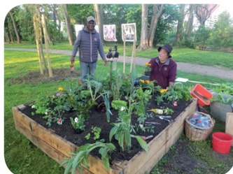
Les artistes au travail

Il est 8 h, le soleil montre le bout du nez sur le jardin éphémère. Il est temps de prendre un café bien mérité.