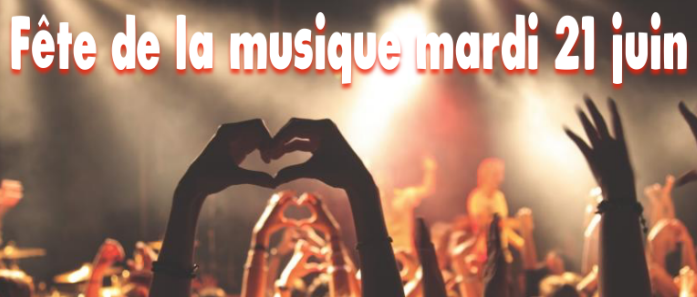
La première édition de la fête de la musique en France: 1982