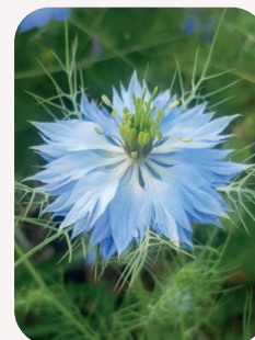
La mariée était en bleu

Suivez-nous sur notre page Facebook : ics sausheim - Pour nous écrire : icsausheim@gmail.com Donnez-nous votre avis! Laissez-nous un message : 03.89.45.65.56