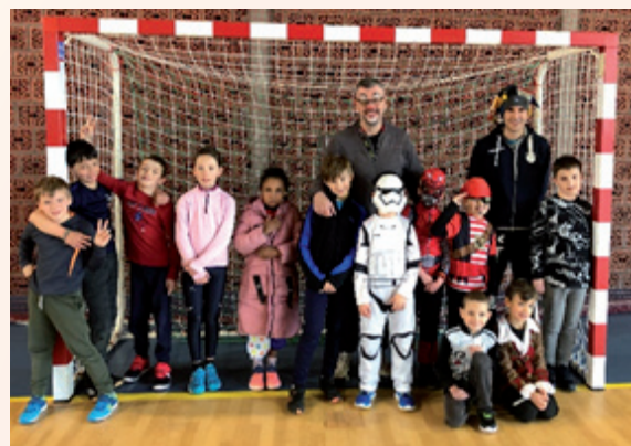
Moins de 9