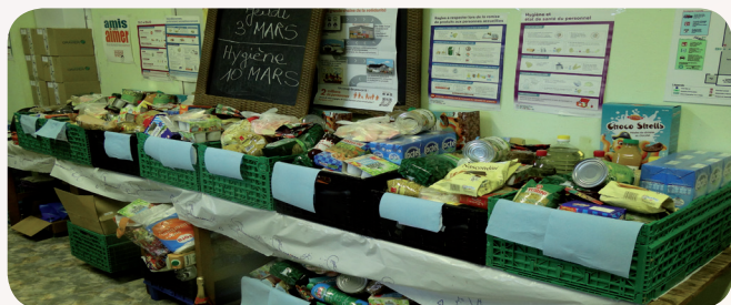
Dans les locaux de St Vincent de Paul

Les 18 élus du Conseil Municipal des Jeunes ont validé à l'unanimité une action de solidarité en faveur des personnes les plus démunies habitant notre village. Ils ont défini leur plan d'action : prise de contact avec l'association Saint Vincent de Paul de Sausheim, puis recherche de slogans, création d'affiches et de tracts pour sensibiliser leurs camarades dans les écoles. Ainsi sensibilisés, les écoliers des 3 groupes scolaires ont témoigné de leur solidarité active en apportant, grâce à leurs parents, suffisamment de denrées alimentaires pour confectionner 30 paniers destinés aux familles en difficulté accompagnées par les bénévoles de l'association Saint Vincent de Paul. Les jeunes élus ont été vivement félicités par les bénévoles de l'association, ainsi que par M. le Maire.